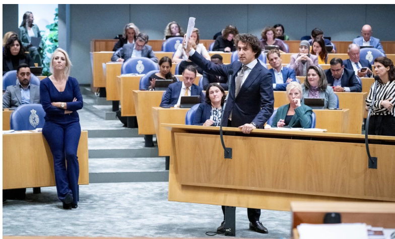
Jesse Klaver (GroenLinks) in de Tweede Kamer.